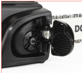
Werkzeugloser Kettenspanner (TLC)