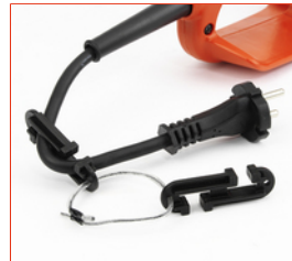
Optimale Kabelführung durch Zugentlastung