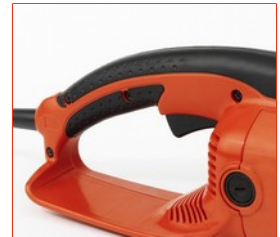
Der ergonomische Softgriff und der große Einschalthebel sorgen für mehr Sicherheit und Bequemlichkeit